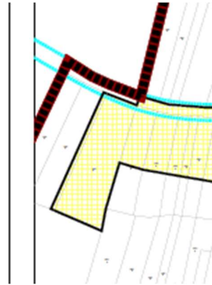
Isječak iz ispravljenog kartografskog prikaza