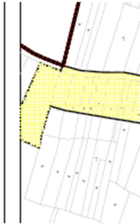
Isječak iz važećeg kartografskog prikaza