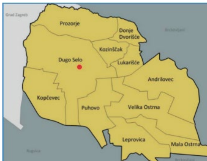
Slika 2. Naselja u Dugom Selu

Grad Dugo Selo administrativno obuhvaća 11 naselja koja su dio zagrebačke aglomeracije. To su: Andrišovec, Donje Dvorišće, Dugo Selo, Kopčevac, Kozinišćak, Leprovica, Lukarišće, Mala Ostrna, Prozorje, Puhovo i Velika Ostrna. Središnje naselje je Dugo Selo, gdje živi većina stanovništva.