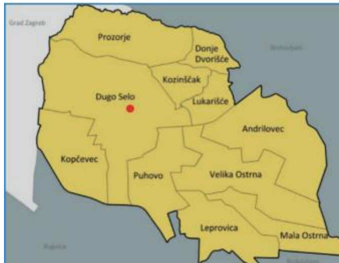
Slika 2. Naselja u Dugom Selu

Grad Dugo Selo administrativno obuhvaća 11 naselja koja su dio zagrebačke aglomeracije. To su: Andrilovac, Donje Dvorišće, Dugo Selo, Kopčevac, Kozinišćak, Leprovica, Lukarišće, Mala Ostrna, Prozorje, Puhovo i Velika Ostrna. Središnje naselje je Dugo Selo, gdje živi većina stanovništva.