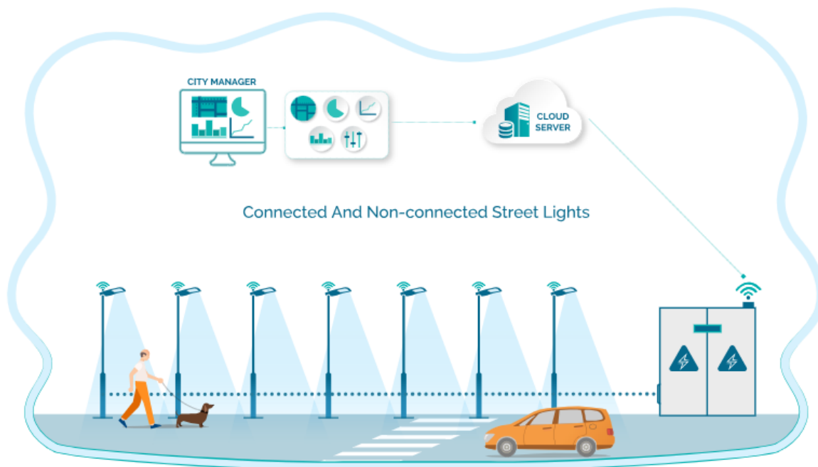
Slika 2. Slikoviti prikaz kompletnog sustava javne rasvjete